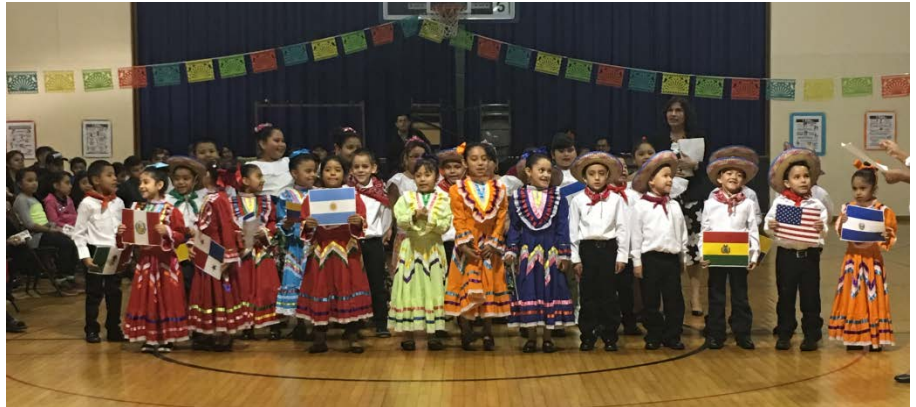
Students and families from North Elementary School celebrate National Hispanic Heritage Month! ¡Los alumnos y familias de North Elementary School celebran el Mes Nacional de la Herencia Hispana!