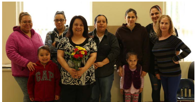
Parents and children alike have enjoyed the "Cafecito con Angela" workshops held at North school!