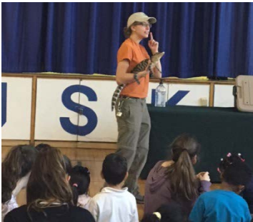
The After School Enrichment Program students had so much fun meeting a real life armadillo!